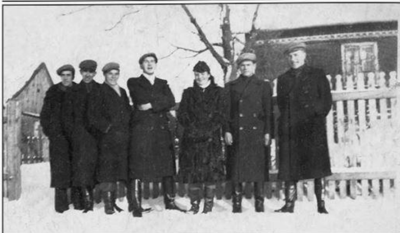
Pluton AK z Opaczy, styczeń 1943 r.

odebrano też 9 zasobników i paczek ze sprzętem (zasobniki 1 GR, 3 PPanc, 3 AMPPanc, 2 S).