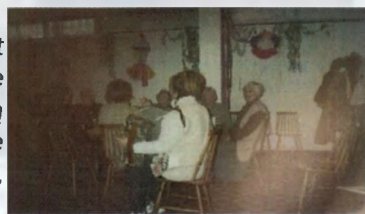
Fot. Walentynki dla seniorów