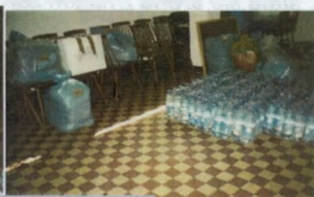
Fot. Dary dla powodzian

Współpracując z różnymi lokalnymi podmiotami Spółdzielnia udostępniła swoje lokale na cele społeczne. W jednym z budynków nieruchomości Kopernika 3 prowadzona była świetlica środowiskowa z której korzystały wszystkie dzieci. Świetlica ta zmieniła swoją siedzibę dopiero w roku 2010, przenosząc się do lokalu większego, o wyższym standardzie technicznym. Swoje lokale udostępniła też dla innych celów np. jako lokale wyborcze.