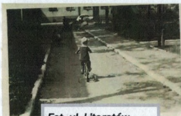
Fot. ul. Literatów

Do roku 1962 w miejscu tym wybudowane zostanie 9 bloków, dla osiedla ulokowanego w rejonie ulic Wilanowskiej i Literatów zapożyczona zostaje funkcjonująca nazwa położonego tu dotąd parku Grapa, która z czasem rozciągnie się na wszystkie bloki wybudowane w tym rejonie. Mimo połączenia miast, historia podziału zachowała się w kodach pocztowych. Dla dawnego Skolimowa - Konstancina na zachód od Wilanowskiej obowiązuje kod 05-510, zaś dla dawnej gminy Jeziorna kod 05-520, w blokach po wschodniej stronie ulicy Wilanowskiej. Siedem następnych bloków stawianych jest już przez Mirkowską Spółdzielnię Mieszkaniową po stronie Skolimowa -Konstancina, jednocześnie z blokami położonymi bliżej skarpy.