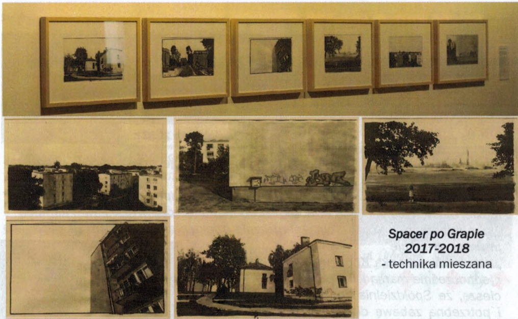
Spacer po Grapie 2017-2018 - technika mieszana

Prace prezentowane na wystawie pt. „Konfrontacje cz. II” 06.04 - 19.05.2019 r. w Konstancińskim Domu Kultury, Hugonówka.