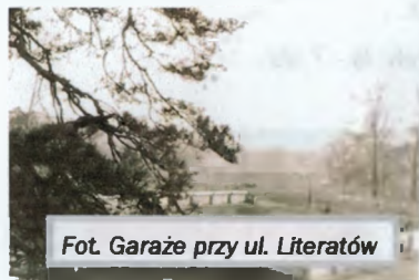
Fot. Garaże przy ul. Literatów