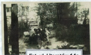
Fot. ul. Literatów 14a

Pierwsze bloki budowano szybko i tanio, aby rozwiązać problem mieszkaniowy pracowników Mirkowa. Stąd po dziś dzień nie posiadają centralnego ogrzewania. Przy zasiedlaniu obowiązywała norma metrażowa, zatem dziewięć osób mieszka w dwóch pokojach z kuchnią, a małżeństwo z dwojgiem dzieci w kawalerce. Kolejne sześć bloków powstało już pod auspicjami zawiązanej świeżo Spółdzielni Mieszkaniowej „Mirków”, a wkłady własne pozwoliły na większy luksus,