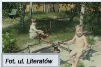
Fot. ul. Literatów