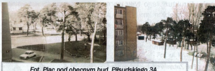
Fot. Plac pod obecnym bud. Piłsudskiego 3A.