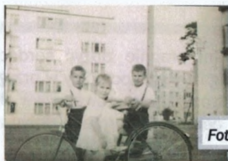
Fot. ul. Wilanowska

Obecnie, w dobie gospodarki rynkowej i zmian społeczno-gospodarczych, działalność Spółdzielni koncentruje się głównie na realizacji podstawowych celów statutowych.