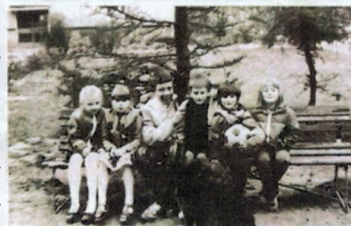
Fot. ul. Kopernika