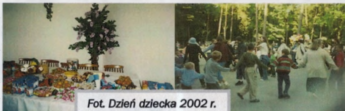
Fot. Dzień dziecka 2002 r.

Współorganizowały imprezy dla szerokiego kręgu odbiorców, pozyskując na ten cel środki finansowe od sponsorów. W kronikach Spółdzielni zachowały się wpisy uczestników zabawy, odzwierciedlające emocje mieszkańców – uczestników imprez.