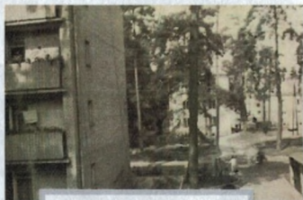
Fot. ul. Mickiewicza