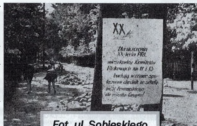
Fot. ul. Sobieskiego

kolejnych bloków dla pracowników WZP, przy ulicy Kopernika i Literatów, w tym celu wykarczowane zostają drzewa w kierunku Jeziorki. W kolejnej dekadzie bloki zostaną wzniesione przy ulicy Sobieskiego. W nowobudowanych blokach normą staje się centralne ogrzewanie. Na początku lat osiemdziesiątych wszystkie budynki wielorodzinne określane są już jako bloki na Grapie, niezależnie od tego czy należą do Spółdzielni, czy podlegają tutejszej gminie. Transformacja po 1989 r. umożliwia przerwanie związków z Mirkowską Fabryką Papieru.