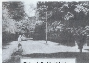
Fot. ul. Sobieskiego

Nowa nazwa Spółdzielni, po akceptacji Centralnego Związku Spółdzielni Budownictwa Mieszkaniowego z siedzibą w Warszawie, przy ul. Jasnej 1, została zarejestrowana 08.11.1969 r. przez właściwy w owym okresie Sąd Rejestrowy. Rozszerzony został też zakres prowadzonej działalności poprzez „zaspakajanie potrzeb mieszkaniowych członków i