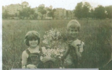
Fot. Osiedle Grapa lata 80